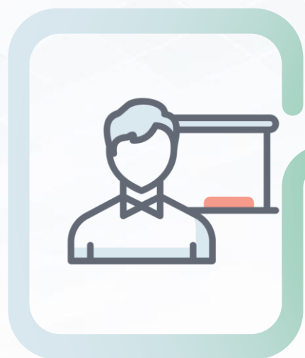
выпускники текущего года