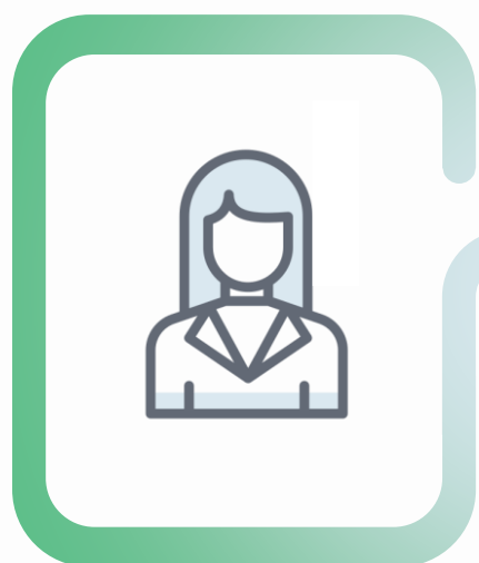
выпускники прошлых лет